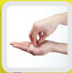
4 NETTOYER LES ONGLES