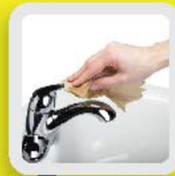
7 FERMER AVEC LE PAPIER