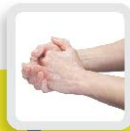
3 FROTTER DE 15 À 20 SECONDES